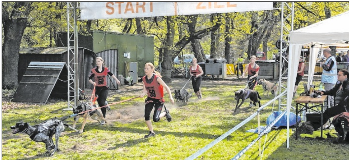
SO GEHT BIATHLON MIT HUND: Rennen und Schießen sind die Disziplinen, die die Vierbeiner mit Frauchen oder Herrchen zu absolvieren haben. Heute und morgen treten die Teams in Hockenheim an.

Und das sieht so aus: die Mensch-Hund-Teams rennen dreimal 700 Meter, wobei hier Teamarbeit groß geschrieben wird, denn die Vierbeiner laufen voraus und die Zweibeiner müssen sich möglichst dem Tempo anpassen, aber auch ihren Hund so gut einschätzen können, um Überforderung zu vermeiden. Dazwischen kommt Laserschießen im Stehen und im Liegen aus zehn Meter Entfernung auf 60 Millimeter-Ziele, während Hund geduldig wartet, bis Mensch hoffentlich ohne Fehler getroffen hat.